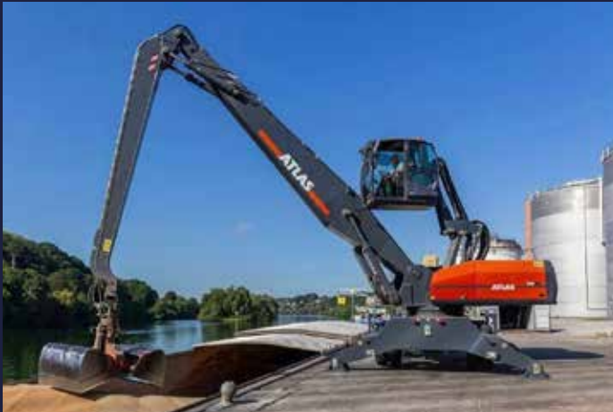
... ein von MSG gelieferter ATLAS Umschlagbagger MH 520 an der Donau ...

Gute Auftragslage und viele ausgelieferte Baummaschinen und Fahrzeuge – diese Bilder aus dem Januar zeigen es: