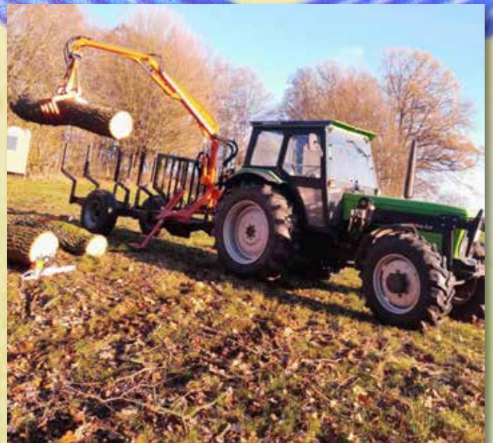
Wieder im Einsatz der ATLAS Bauerlader