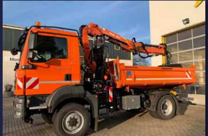
... der ATLAS Ladekran AK 88.3 für die Region Mittelhessen ...