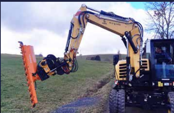
... oder der YANMAR Mobilbagger beim Heckenschnitt.