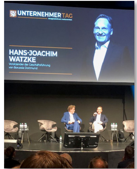
Podiumsdiskussion mit Hans-Joachim Watzke

Zukunfts-Visionen und Ideen würden bei der MSG nicht nach Gutsherren-Art von oben diktiert, sondern gemeinsam mit den Mitarbeitern entwickelt.