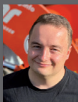
Sebastian Kater Beratung Ersatzteile