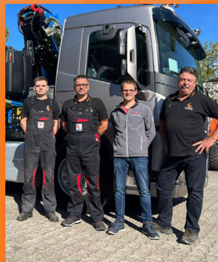
LKW-Aufbauten, Beratung und Umsetzung