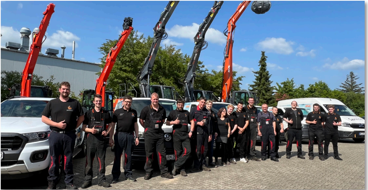
Das Service und Werkstattteam, hochwertige Leistungen am Standort oder mobil beim Kunden

Die MSG Maschinen Service Gruppe konnte durch neue Mitarbeitermodelle, eine intensive Ausbildung und Förderung sowie durch die durchgängige Digitalisierung ihrer Prozesse punkten.