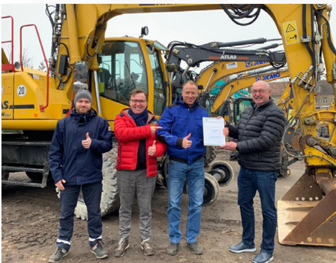
Team BauCharter Teuchern