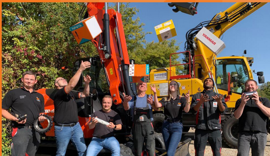
Unser Online-Shop-Team: 8 Mitarbeiter, 90.000 Baumaschinen-Artikel, insgesamt 450.000 Artikel