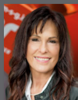
Irina Reichenbach Ersatzteile