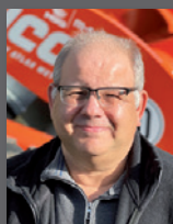
Stefan Nau Beratung Ersatzteile